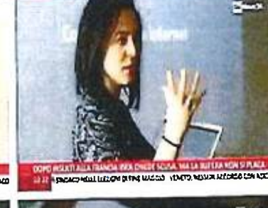
DOPO INSEI ALLA FRANGIA BSA CHIEDI SCUSA, MA LA BUTTELLA NON SI PLACA 22:21 DOPO INSEI ALLA FRANGIA BSA CHIEDI SCUSA, MA LA BUTTELLA NON SI PLACA