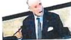
Assolombarda lancia Abc Digital per avvicinare over 60 a Pc

Milano, 16 mar. (askanews) - Assolombarda ha presentato Abc Digital, il programma di alfabetizzazione digitale per le persone over 60 delle province di Milano Lodi Monza e Brianza. L'iniziativa, che fa parte del piano strategico di Assolombarda per "far volare Milano punta a concorrere significativamente alla riduzione del digital divide al fine di rendere realizzabili a Milano gli obiettivi dell'Agenda Digitale europea per la competitività del territorio, e fare della nostra area metropolitana una città digitale accessibile e fruibile da tutti i cittadini.