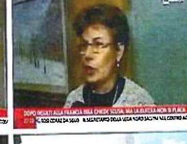
DOPO INSEI ALLA FRANGIA BSA CHIEDI SCUSA, MA LA BUTTELLA NON SI PLACA 22:21 DOPO INSEI ALLA FRANGIA BSA CHIEDI SCUSA, MA LA BUTTELLA NON SI PLACA