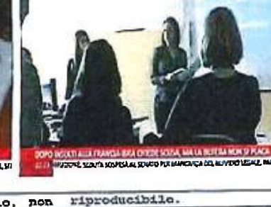
DOPO INSEI ALLA FRANGIA BSA CHIEDI SCUSA, MA LA BUTTELLA NON SI PLACA 22:21 DOPO INSEI ALLA FRANGIA BSA CHIEDI SCUSA, MA LA BUTTELLA NON SI PLACA

Ritaglio stampa ad uso esclusivo del destinatario, non riproducibile.