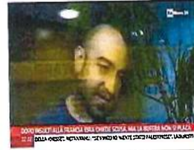
DOPO INSEI ALLA FRANGIA BSA CHIEDI SCUSA, MA LA BUTTELLA NON SI PLACA 22:21 DOPO INSEI ALLA FRANGIA BSA CHIEDI SCUSA, MA LA BUTTELLA NON SI PLACA