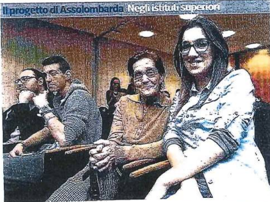
Il progetto di Assolombarda Negli istituti superiori