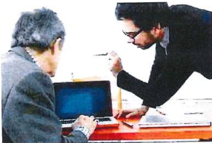
Al via un percorso per gli anziani di alfabetizzazione sul mondo del pc

Il progetto "Abc digital" promosso da Assolombarda servirà a migliorare il livello di alfabetizzazione e ad accrescere la familiarità verso il mondo del Pc, internet e social network delle persone della terza età. I corsi della durata di 8 ore incominceranno ad aprile. Coinvolti 21 istituti didattici