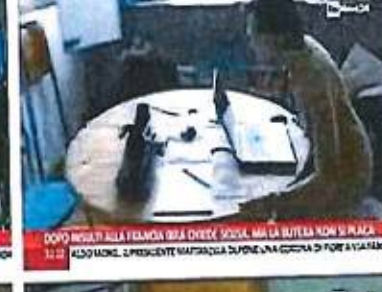
DOPO INSEI ALLA FRANGIA BSA CHIEDI SCUSA, MA LA BUTTELLA NON SI PLACA 22:21 DOPO INSEI ALLA FRANGIA BSA CHIEDI SCUSA, MA LA BUTTELLA NON SI PLACA