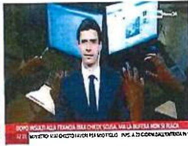
DOPO INSEI ALLA FRANGIA BSA CHIEDI SCUSA, MA LA BUTTELLA NON SI PLACA 22:21 DOPO INSEI ALLA FRANGIA BSA CHIEDI SCUSA, MA LA BUTTELLA NON SI PLACA