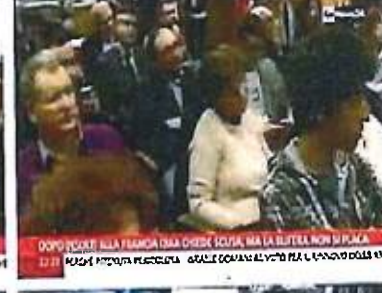
DOPO INSEI ALLA FRANGIA BSA CHIEDI SCUSA, MA LA BUTTELLA NON SI PLACA 22:21 DOPO INSEI ALLA FRANGIA BSA CHIEDI SCUSA, MA LA BUTTELLA NON SI PLACA