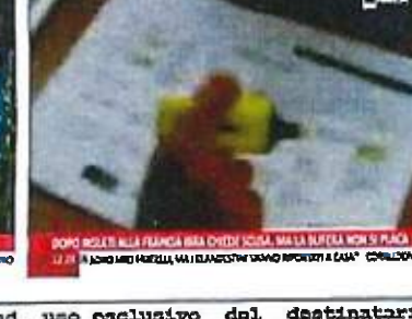
DOPO INSEI ALLA FRANGIA BSA CHIEDI SCUSA, MA LA BUTTELLA NON SI PLACA 22:21 DOPO INSEI ALLA FRANGIA BSA CHIEDI SCUSA, MA LA BUTTELLA NON SI PLACA