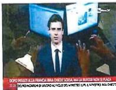
DOPO INSEI ALLA FRANGIA BSA CHIEDI SCUSA, MA LA BUTTELLA NON SI PLACA 22:21 DOPO INSEI ALLA FRANGIA BSA CHIEDI SCUSA, MA LA BUTTELLA NON SI PLACA