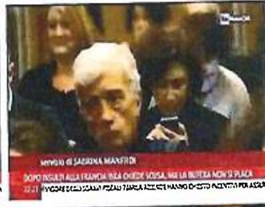
INSEI DI SAGGINA MANFRO DOPO INSEI ALLA FRANGIA BSA CHIEDI SCUSA, MA LA BUTTELLA NON SI PLACA 22:21 DOPO INSEI ALLA FRANGIA BSA CHIEDI SCUSA, MA LA BUTTELLA NON SI PLACA