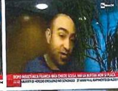
DOPO INSEI ALLA FRANGIA BSA CHIEDI SCUSA, MA LA BUTTELLA NON SI PLACA 22:21 DOPO INSEI ALLA FRANGIA BSA CHIEDI SCUSA, MA LA BUTTELLA NON SI PLACA