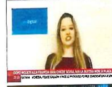
DOPO INSEI ALLA FRANGIA BSA CHIEDI SCUSA, MA LA BUTTELLA NON SI PLACA 22:21 DOPO INSEI ALLA FRANGIA BSA CHIEDI SCUSA, MA LA BUTTELLA NON SI PLACA