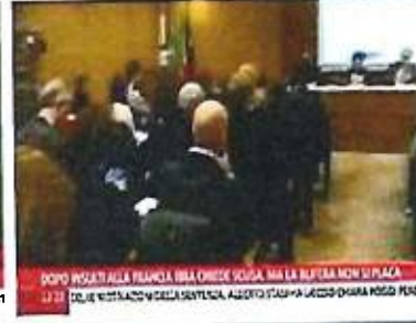
DOPO INSEI ALLA FRANGIA BSA CHIEDI SCUSA, MA LA BUTTELLA NON SI PLACA 22:21 DOPO INSEI ALLA FRANGIA BSA CHIEDI SCUSA, MA LA BUTTELLA NON SI PLACA