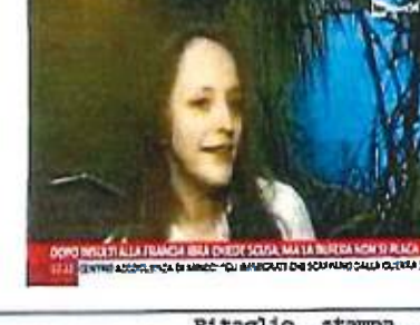
DOPO INSEI ALLA FRANGIA BSA CHIEDI SCUSA, MA LA BUTTELLA NON SI PLACA 22:21 DOPO INSEI ALLA FRANGIA BSA CHIEDI SCUSA, MA LA BUTTELLA NON SI PLACA